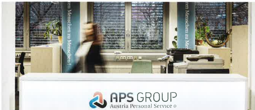
Unter dem Motto „Wir führen Menschen zu Menschen“ steht die APS Group österreichweit für höchste Qualität und Kundenzufriedenheit

In Zeiten des demografischen Wandels und des Fachkräftemangels braucht es einen verlässlichen Partner, dem man in allen HR- und Personal-Angelegenheiten vertrauen kann. Durch umfangreiche Betreuung und fachliche Kompetenz führt die APS Group bereits seit über 30 Jahren die richtigen Bewerber mit den richtigen Unternehmen zusammen. Dabei vermittelt das Familienunternehmen mehr als nur passende Jobs. Es findet Aufgaben für Menschen, die sie motivieren und erfüllen.