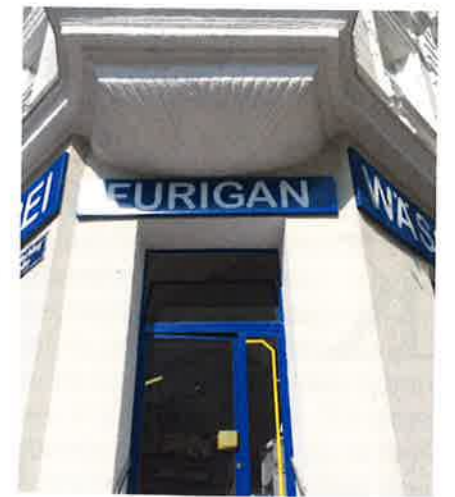
Eingangsbereich des Betriebs

das Unternehmen stark gewachsen. Die Anschaffung einer größeren Bügel- und Waschmaschine war notwendig, um die Kundenanfragen und Wünsche weiterhin bestmöglich zu befriedigen“, so Furigan. Mit den Investitionen wurde auch für die Mitarbeiter, die mit ihrer Hingabe und Tatkraft maßgeblich am Erfolg des Unternehmens beteiligt sind, ein Zeichen für den Bestand des Betriebs gesetzt.